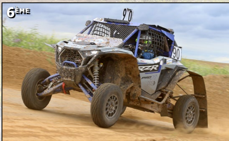
#90 Crevecoeur Hervé / Crevecoeur Maxime / Crevecoeur Valentin