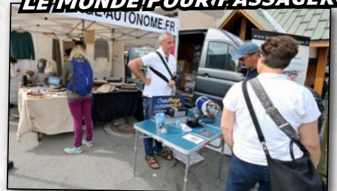
LE MONDE POUR PASSAGER