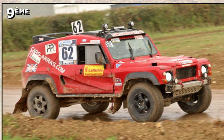
#62 Coquelle Alain / Boilly Coquelle Louis / Baudens Ludovic

souci mécanique pouvait inverser les choses. Derrière, par contre, les écarts s'étaient plus sérieusement creusés. Le Polaris Pro R #2 du team Kartshop By Rdv pointait déjà à 10 tours tandis que le MMP #5 de l'écurie Cap Off Road accusait un déficit de 13 tours tout comme le Can-am #44 aux couleurs de Cap Off Road. Un classement intermédiaire où manquaient certaines autos qui s'étaient illustrées lors des essais chronométrés. À commencer par les deux T1A du team Off Road Concept. La 206CC #26 ayant connu un souci d'étrier grippé durant la première heure de course, elle naviguait en milieu de peloton, aux alentours de la 23 ème place. De son côté, alors qu'elle occupait la cinquième place du général, peu avant 19 heures, la Galland Honda #59 dut s'arrêter au stand définitivement après un début