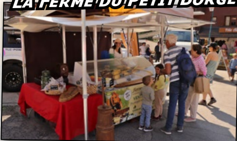
LA FERME DU PETIT BORGÉ