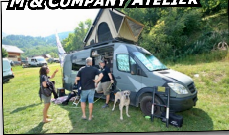
M & COMPANY ATELIER