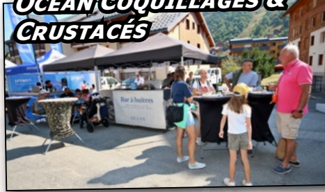
Océan COQUILLAGES & CRUSTACÉS