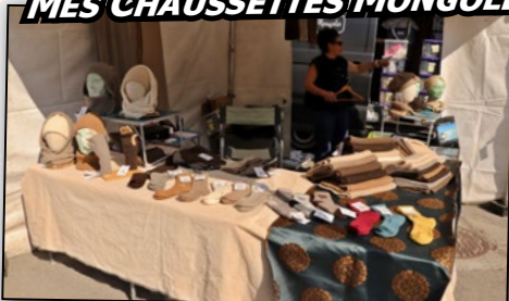
MES CHAUSSETTES MONGOLES