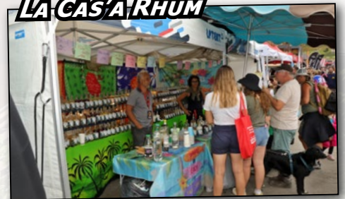
LA CAS'A RHUM