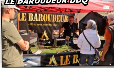
LE BAROUDEUR BBQ