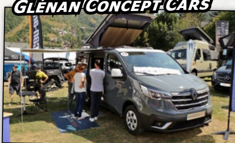
GLÉNAN CONCEPT CARS